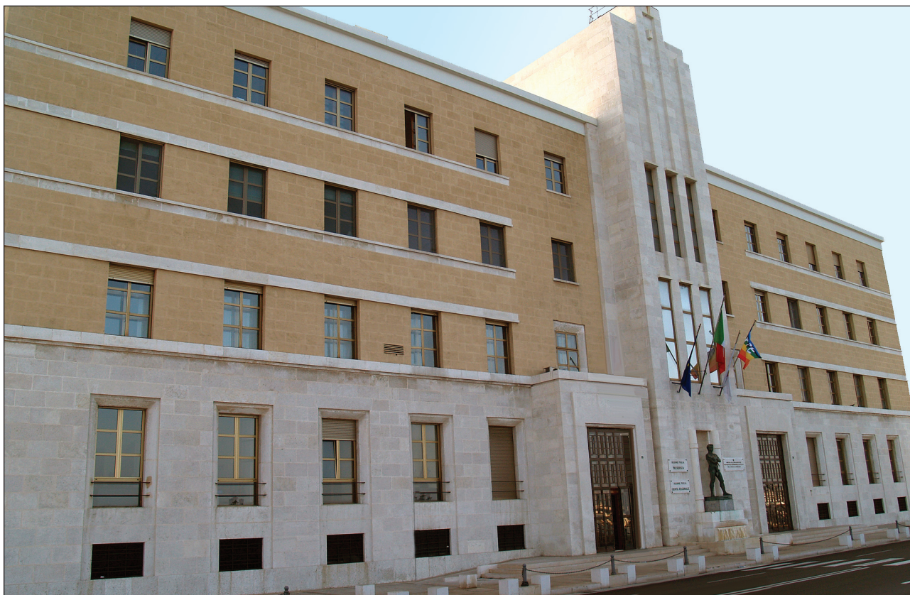
Sede Presidenza Giunta Regionale

Deliberazioni del Consiglio e della Giunta