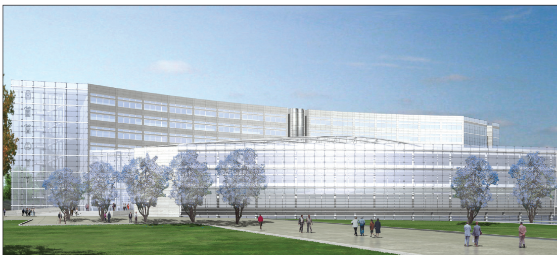
Progetto nuova sede Consiglio Regionale